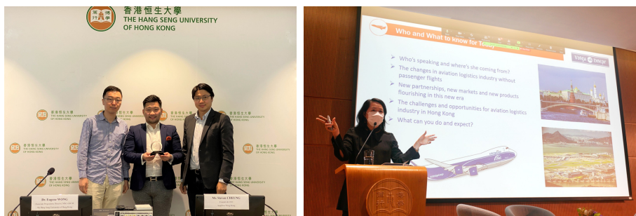
邀業界人士到校主持講座，與學生分享業界經驗

課程內容上，她直言十分喜歡「管理人員的決策建模(Decision Modelling for Managers)」這科，因為課題跟生產計劃很有關，要利用不同的數據推算貨物的進度、產能、質量等，她笑言：「成功做出一份綜合平衡的生產計劃，便是工作最大的滿足感！」